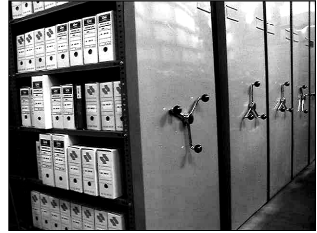
Figures 14, 15, 16.- Disposició final de les unitats d'instal·lació en els armaris compactes.