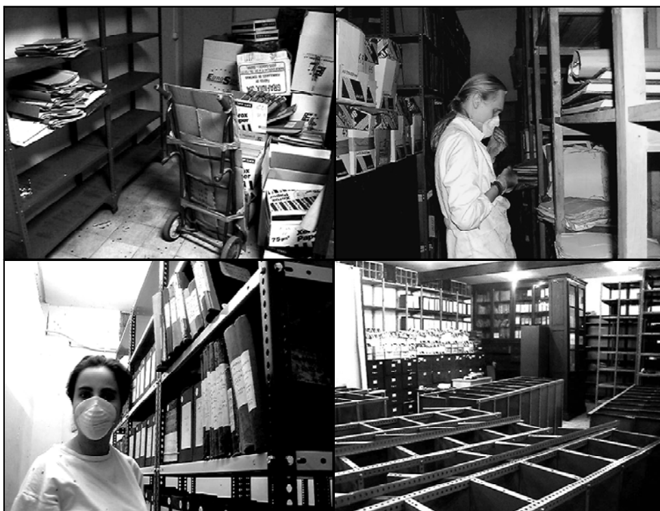
Figures 10, 11, 12.- Tasques d'eliminació documental, de registre documental i de condicionament de les àrees de dipòsit (muntatge d'armaris compactes).