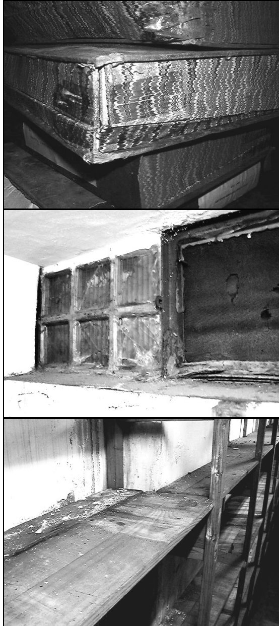
Figures 7, 8, 9.- Problemàtiques de conservació documental: deteriorament de les unitats d'instal·lació i de les infraestructures; mobles de dipòsit de fusta.