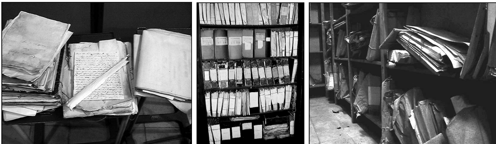
Figures 1, 2, 3.- Estat d'una part de la documentació i dels mobles d'instal·lació de l'Arxiu històric de l'ETSEIB (abans de la definició del nou pla arxivístic de gestió integral).